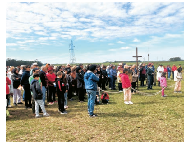
Vía Crucis y Misa en la gruta del P. Pio en La Aurora (diócesis de Salto –Uruguay–) celebrada en septiembre de 2022

Las propuestas finales de la primera Asamblea Eclesial nos dicen: “La fuerza que tiene la certeza de la fe en la igualdad fundamental entre todos los bautizados y la diversidad de los miembros del Cuerpo de Cristo es una oportunidad de crecimiento mutuo”. Y agrega: “Uno de los reclamos más fuertes es la necesidad de superar el clericalismo”. Más adelante nos dice, “se registra un anhelo cada vez más firme de crecer en sinodalidad, pues significa caminar juntos corresponsablemente con el devenir de nuestra Iglesia. Se multiplican los signos que invitan a una conversión pastoral que abra caminos de mayor participación de todo el Pueblo de Dios”. Todo un desafío para el caminar de la Iglesia del continente. ¡Que podamos avanzar en ese sentido como discípulos y misioneros! ●