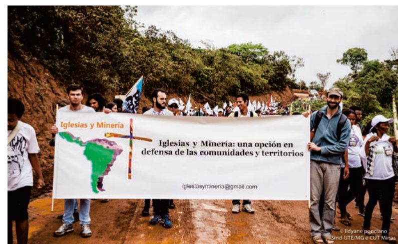
A la izquierda, la presa de Brumadinho. Arriba, marcha contra Bolsonaro. Abajo, concentración de Iglesias y Minería

por el gobierno de Bolsonaro fue la cantidad de conflictos que causaron muertes de pueblos indígenas. El informe Conflictos en el Campo Brasil 2021 de la Comisión Pastoral de la Tierra mostró que la minería ilegal fue el principal factor de ocurrencia de la violencia en el campo. Estos causaron el 92% de las muertes por conflictos registradas.