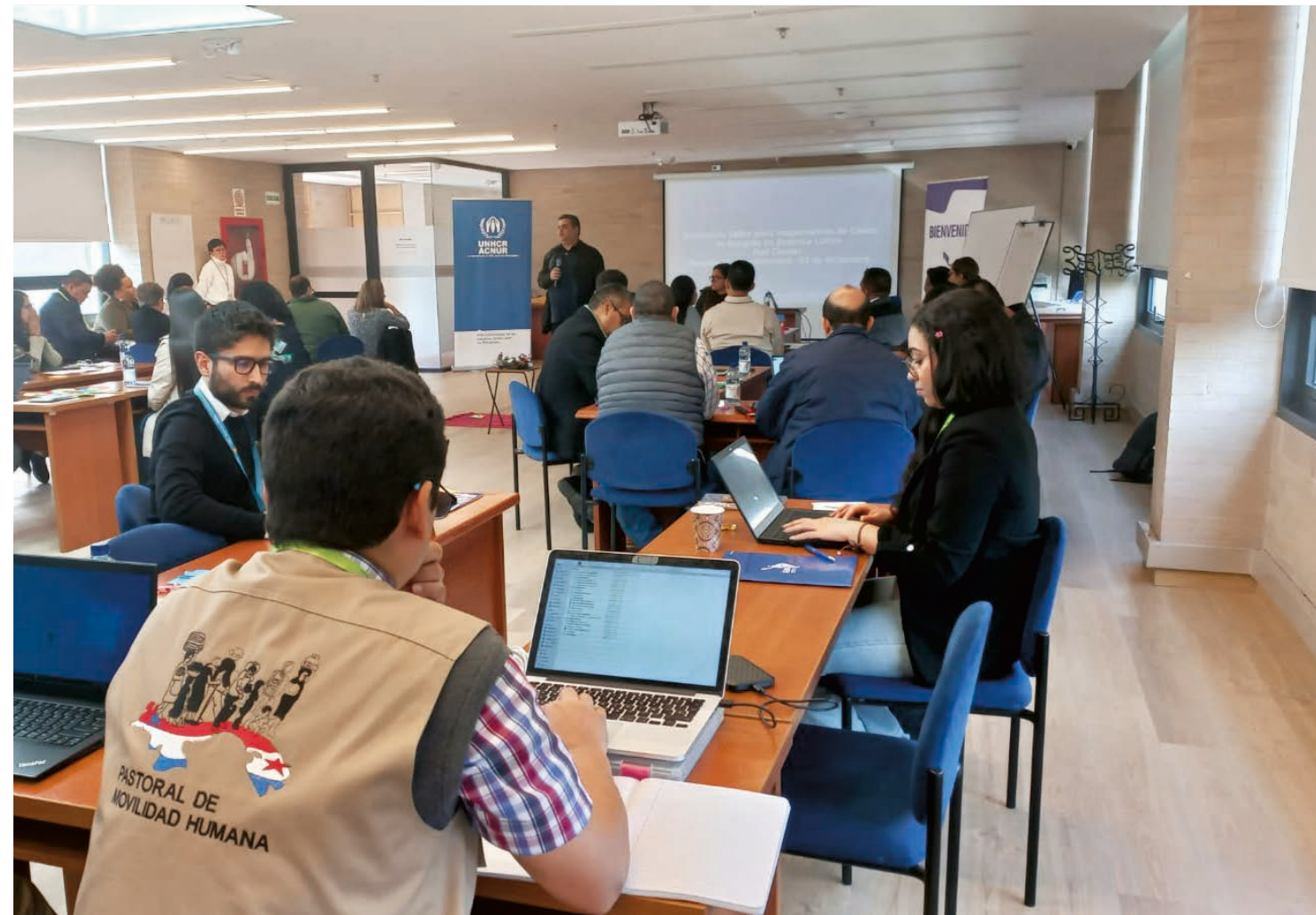
Encuentro de Casas del Migrante celebrado en la sede del Celam

El encuentro se inició recordando los principios humanitarios que orientan la atención a las personas en condición de movilidad, refugio o migración. Situación que, bien sabemos, es una constante en la realidad de este tiempo para nuestro continente y en la que no deben ahorrarse esfuerzos para ofrecer el debido acompañamiento a las personas que, por una u otra razón, decidieron o se vieron obligadas a partir de sus lugares de origen para reconstruir su vida, mejorarla o transformarla. Igualmente, se analizaron temas como la necesidad de prepararse para brindar una atención que incluya un enfoque de gé-