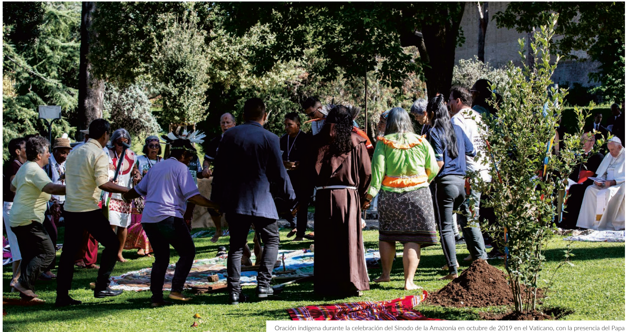
Oración indígena durante la celebración del Sínodo de la Amazonía en octubre de 2019 en el Vaticano, con la presencia del Papa